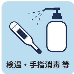
検温・手指消毒等

会場出入口では、検温・手指消毒・入場者数調整などを実施しております。このため、入場の際は少しお待ちいただくこともございます。